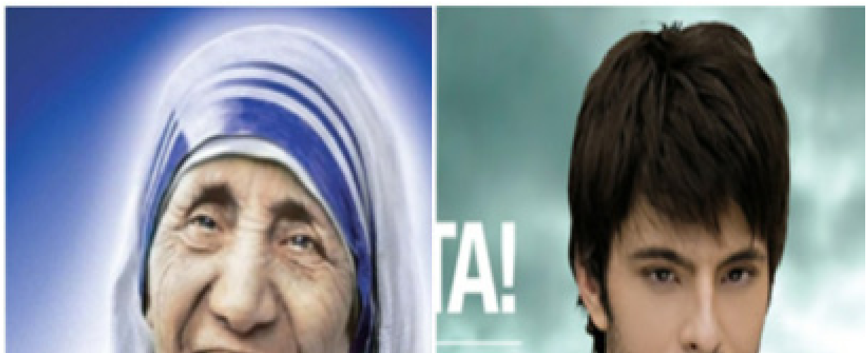
Slika 4. Kombinacija za studente Sveučilišta u Ohridu – Sveta Majka Terezija i Toše Proeski Figure 4. Combination for students of the University of Ohrid - Saint Mother Terezija i Toše Proeski

nik poznao ovu tehniku? Ili kakve bi tek tada kodove mogli smišljati u Hollywoodu [30].