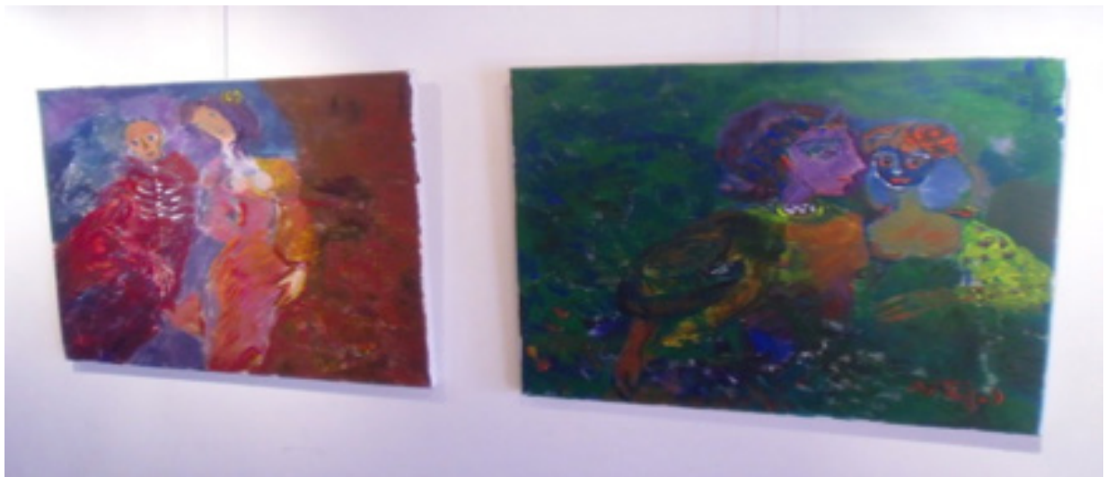
Slika 3a. Slike vidljive pod infracrvenim svjetlom Figure 3a. Images visible under infrared light

skih uradaka. Ovdje pak treba ozbiljno postaviti hipotetičko pitanje: Što bi bilo da je veliki umjet-