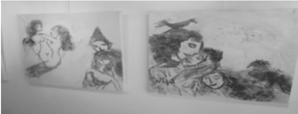
Slika 3. Slike vidljive pod infracrvenim svjetlom Figure 3. Images visible under infrared light