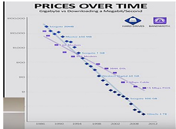
Ilustracija 3: Kapacitet diska i bandwidth[4]

Mnogi podatci se kasnije mogu trajno sačuvati emulacijom tehnologije. Postavlja pitanje gdje će se trajno pohraniti emulatori. IPFS pokušava biti tehnologija na kojoj bi se emulatori mogli sigurno pohranjivati.