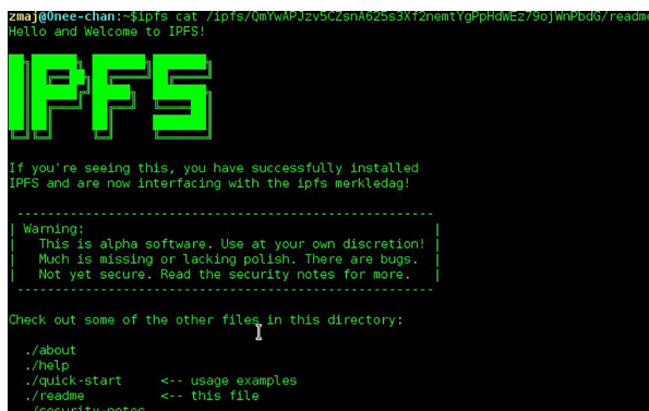
Ilustracija 4: IPFS pozdravna poruka

IPFS se može instalirati i na Windows operacijskim sustavima. Da bi se IPFS instalirao na windowse prvo se mora preuzeti paket za windowse sa službenih stranica. Zatim se taj paket mora raspakirati.