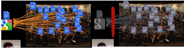
Ilustracija 2: Centralizirani kolaborativni web servis[4]

Illustration 2: Centralized collaborative web service