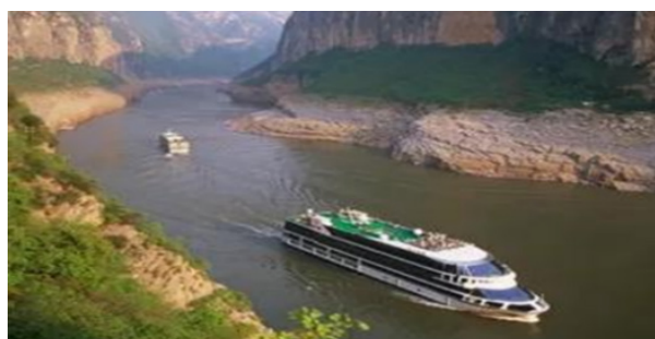
Slika 8 Turističko krstarenje rijekom Yangtze [6]

sela, 1600 tvornica i 700 odgojno-obrazovnih ustanova, a raseljeno je oko 1,3 milijuna ljudi [14]. Većina preseljenih ljudi smještena je u izgrađene stambene objekte i gradove. Do 2007. godine zabilježeno je oko 4700 klizišta na području sliva kao posljedica formiranja akumulacije. To je dovelo do dodatnog iseljavanja, pa je realnija brojka premještenih stanovnika iznosi 2,3 milijuna. Stoga, projekt nije koštao 37 milijardi dolara, nego 75 milijardi američkih dolara [14]. Potapanjem velikog područja, ugroženi su mnogi povijesni i arheološki lokaliteti. Za sada je identificirano njih 1208, s tim da ta brojka obuhvaća i 30 lokaliteta iz kamenog doba, starih između 30 000 i 50 000 godina. Za njihovu identifikaciju izdvojena su novčana sredstva od 125 milijuna američkih dolara, a veliku ulogu su odigrali arheolozi iz čitavog svijeta. Značajno su unaprjeđeni uvjeti za plovidbu na rijeci Yangtze koja je postala „žila kucavica“ unutarnjih plovinih puteva NR Kine. Kapacitet godišnjeg jednosmjernog prometa je povećan sa 10 milijuna t/god na 50 milijuna t/god. Prema podacima iz 2019. godine branu je posjetilo 3 milijuna posjetitelja, a od izgradnje brane brojka posjetitelja iznosi preko 20 milijuna. Turističke agencije nude usluge krstarenje rijekom (slika 8) i obilaska brane HE Tri klanca (slika 9) [6].