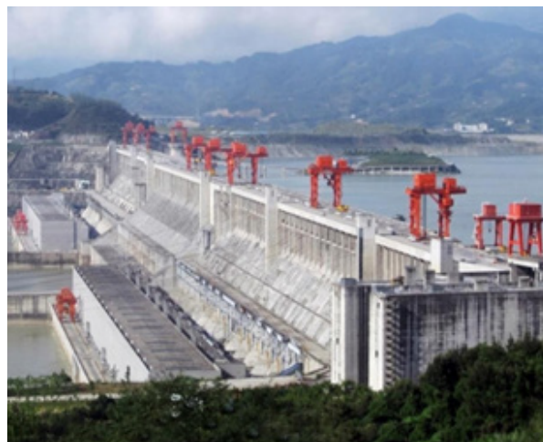
Slika 4 Pogled na HE Tri Klanca [9]