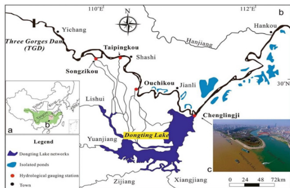
Slika 5 Lokacija jezera Dongting sa pritokama Chenglingjia u srednjem toku Yangtzea [11]