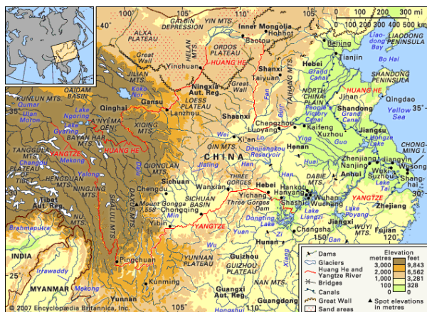
Slika 1 Karta sliva rijeke Yangtze s glavnim pritokama i gradovima [6]