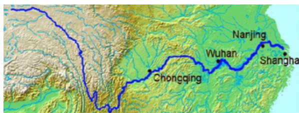
Slika 3 Prikaz položaja HE Tri Klanca i najveći gradovi na rijeci Yangtze [6]

HE Tri klanca izgrađena je kod mjesta Sandoupinga, a lokacija je odabrana temeljem sljedećih kriterija: čvrsta granitna podloga, široka dolina, u krugu od 15 km nema nepovoljnih geoloških struktura i područje ima malu seizmičku aktivnost, mali otočić u sredini toka omogućio je skretanje toka rijeke. HE Tri Klanca prvenstveno je građena radi proizvodnje električne energije, a zatim kao višenamjenski objekt radi vodoopskrbe, poboljšanja unutarnje plovidbe i obrane od poplava. Područje je dobro prometno povezano s ostalim područjima (brza cesta, dobri plovni putevi, velika željeznička stanica, itd.) [10]. HE Tri Klanca nalazi se u blizini grada Chongqing (slika 3), a na slici 4 prikazan je pogled na HE Tri Klanca.