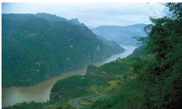
Slika 2 Klanac Xiling [6]

Plavom strelicom, na slici 1, naznačen je položaj HE Tri klanca. U gornjem dijelu toka rijeke Yangtze nalaze se još dvije rijeke koje u tom dijelu teku paralelno s njom, to su rijeke Mekong i Salween [3]. Prije samog ulaska u srednji tok, rijeka se spušta na 300 m n.m.. Većim dijelom, tok rijeke proteže se brdovitim predjelima pokrajine Szechuan, širina rijeke u tom dijelu iznosi između 300 i 500 metara, a brzine su vrlo velike [6]. U tom području smješten je grad Chongqing, koji je ujedno i najveća riječna luka u Kini, a sa svojom okolicom broji oko 30 milijuna stanovnika radi naseljavanja stanovništva iz područja utjecaja HE Tri Klanca. Hidroelektrana Tri klanca je dobila ime prema području u kojem su tri klanca: Qutang, Wu i Xiling, koji je prikazan na slici 2 [6].