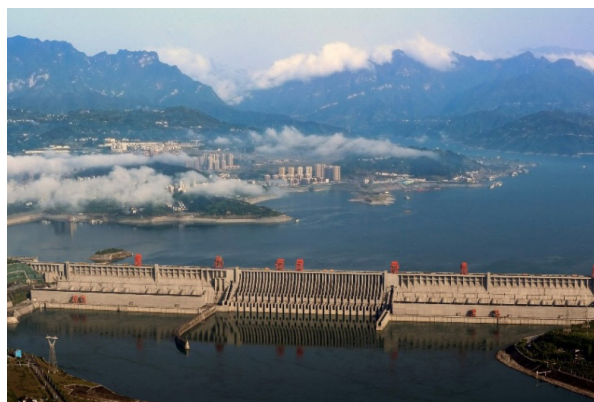
Slika 9 Panorama HE Tri klanca [16]

Figure 8 Tourist cruise on the Yangtze River [6]