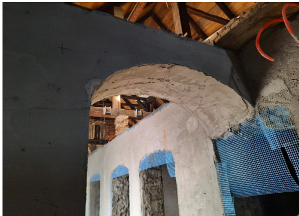
Slika 6 Prikaz ojačanja unutarnjih zidova FRM mrežom Figure 6 Illustration of the reinforcement of internal walls with FRM mesh

potrebna je izvedba pojačanja dijela zidova i nadvoja FRM materijalima-oblogama. FRM oblogu treba adekvatno sidriti u osnovnu zidnu konstrukciju.