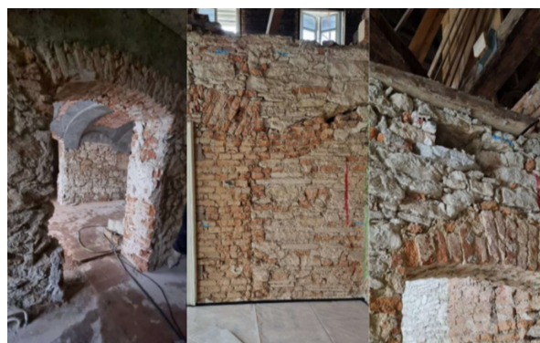
Slika 3 Prikaz stanja zida i svodova nakon skidanja žbuke

Prije izvođenja ostalih metoda sanacije obavljaju se poslovi rušenja i demontaže. Demontiraju se fasadni konzolni elementi, postojeći prozori i fasadna vrata u prizemlju, na katu i potkrovlju jer su dotrajali i potrebno ih je zamijeniti. Jedna od većih stavki je ručno obijanje žbuke da bi se došlo do same cigle (Slika 3.). Uklanjanju se sve obloge i svi postojeći slojevi ispod obloge na svim etažama. Uklanjanju se neki pregradni zidovi i izvode prodori u kamenim zidovima i zidovima od opeke. Na prvom katu uklanjaju se stropovi od trske i žbuke te se demontiraju ostaci postojećih dimnjaka.