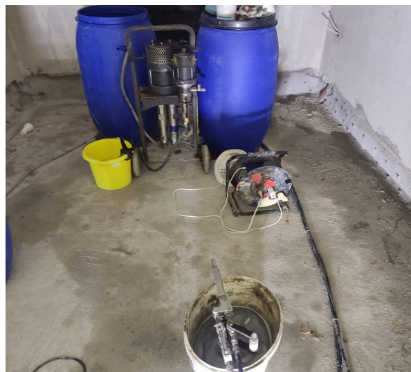
Slika 8 Prikaz pakera za injektiranje i tlačne pumpe kojom se injektiraju zidovi za zaštitu od kapilarne vlage