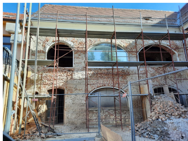
Slika 7 Prikaz starog jugozapadnog pročelja i ojačanog FRM mrežom Figure 7 View of the old southwest facade reinforced with FRM mesh