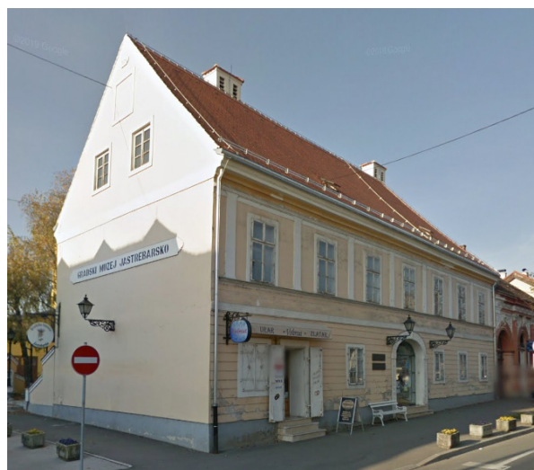
Slika 1 Prikaz objekta prije sanacije

Predmetna građevina, nalazi se unutar zone zaštite Kulturno-povijesne urbanističke cjeline Grada Jastrebarskog (Slika 1). Pripada starijoj građevnoj strukturi te ima urbanističku, arhitektonsku i ambijentalnu vrijednost.