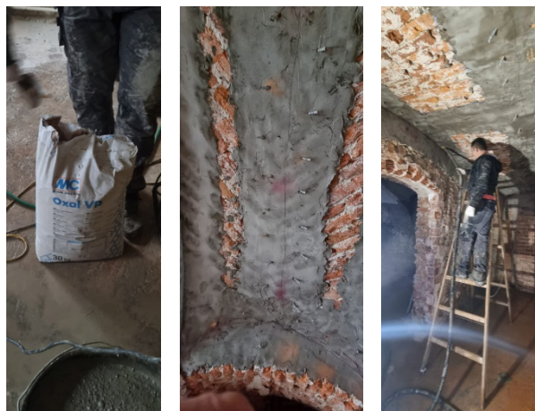
Slika 4 Prikaz materijala, pakera i postupka injektiranja zida zbog ojačanja zida

Injektiranje je postupak popunjavanja pukotina u elementima konstrukcije, kojim statički osnažujemo strukturu elementa, sprečavanja kapilarnog porasta vlage i postizanja vodonepropusnosti konstrukcije. Injektiranje se izvodi pomoću injekcijske tvari koja se odabire na temelju vrste strukture, oštećenja i željenih rezultata. Ugradnja pakera i injektiranje odvija se tako da se prvo iscrta raster bušenja na prethodno pripremljeno površinu te se buše rupe prema iscrtanoj shemi (cca 7 kom/m 2 ), ili sukladno vrsti i gustoći зида (predmet projekta sanacije kapilarne vlage), promjera rupa od 12 do 18 mm pod kutom od najviše 30°. Rupe se buše minimalno do dubine 2/3 debljine zida. Prije ugradnje pakera rupe je potrebno ispuhati zrakom pod pritiskom. Injektiranje viskozno elastične smole na bazi akrilatnog gela izvodi se dvokomponentnom pumpom pod niskim tlakom (Slika 4.). Po završetku injektiranja, uklanjaju se pakeri, a rupe se zatvaraju reparaturnim mortom. Injektiranje se obavljalo dvokomponentnom visoko fluidnom smjesom za ispunu i injektiranje od proizvođača.