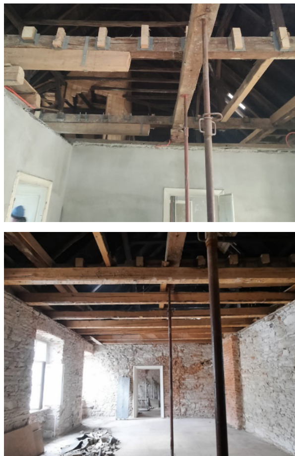
Slika 5 Prikaz radova sanacije na konstrukcije stolice krovišta

ojačanje spojeva drvene konstrukcije stolica tipskim čeličnim elementima (Slika 5.).