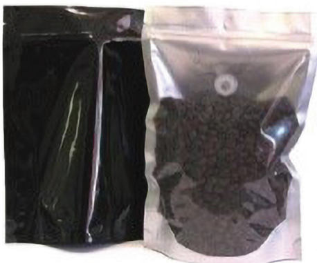
Slika 2 Prikaz pakiranja s ventilom koji sprječava ulaz kisika, a omogućuje izlaz \text{CO}_2

Problemi sa koncentracijom ugljičnog dioksida ( \text{CO}_2 ) su posebno izraženi kod namirnica kao što su mljevena kava i razni sirevi. Kod povećane koncentracije ugljičnog dioksida dolazi do promjene kemijskog sastava, a samim time dolazi i do promjene organoleptičkih svojstava tih namirnica. Kako bi se smanjila koncentracija \text{CO}_2 većinom se koriste jednosmjerni ventili koji su ugrađeni u ambalažu koji dopuštaju izlaz plinova ali ne dopuštaju ulazak [1,2].