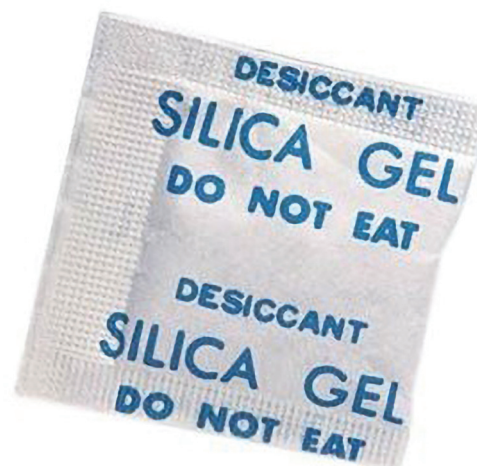
Slika 3 Vrećica sa apsorbirima vlage –silikagel

Povećana koncentracija vlage u samom pakiranju može dovesti do stvaranja različitih mikroorganizama te time i do smanjenja roka trajnosti namirnice. Kako bi se to izbjeglo koriste se različiti desikanti (sredstva za isušivanje) koja na sebe vežu čestice vode [2]. Ona se koriste tako da se stavljaju u prozirne paketiće ili se ugrade u sam materijal ambalaže. Osim kod pakiranja prehrambenih proizvoda desikanti se koriste i kod pakiranja farmaceutskih proizvoda te za pakiranje osjetljivih elektroničkih dijelova. Osim desikanata koriste se i plastične presvlake protiv zamagljivanja koji dozvoljavaju neki stupanj transpiracije proizvoda pa se dio vlage na taj način izbacuje van [2].