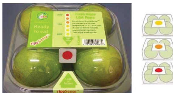
Slika 4 Pokazatelji svježine

Postoje brojni metaboliti koji bi mogli poslužiti kao markeri u razvoju indikatora svježine proizvoda. Neki od primjera su slijedeći: - U mesnim proizvodima se tijekom skladištenja mogu pratiti promjene u koncentraciji organskih kiselina kao što su n-butiratna, L-laktatna, D-laktatna i octena kiselina. Pokazatelji takvih promjena uobičajeno su različiti pH indikatori. - Etanol, zajedno s mliječnom i octenom kiselinom, važan je pokazatelj fermentativnog metabolizma bakterija mliječne kiseline. Istraživanja su pokazala da vrijeme skladištenja marinirane pilettine utječe na povećanje koncentracije etanola u anaerobnom pakiranju s modificiranom atmosferom. U ovom slučaju indikatori koji mogu detektirati etanol su korisni u praćenju kvalitete ovih proizvoda. Još jedan pokazatelj kvarenja namirnice je i ugljikov dioksid koji se javlja kao popratna pojava mikrobiološkog rasta. Izuzetak su pakiranja mesnih proizvoda u modificiranoj atmosferi, gdje je teže pratiti takve promjene jer je koncentracija ugljikovog dioksida dosta visoka [8,9].