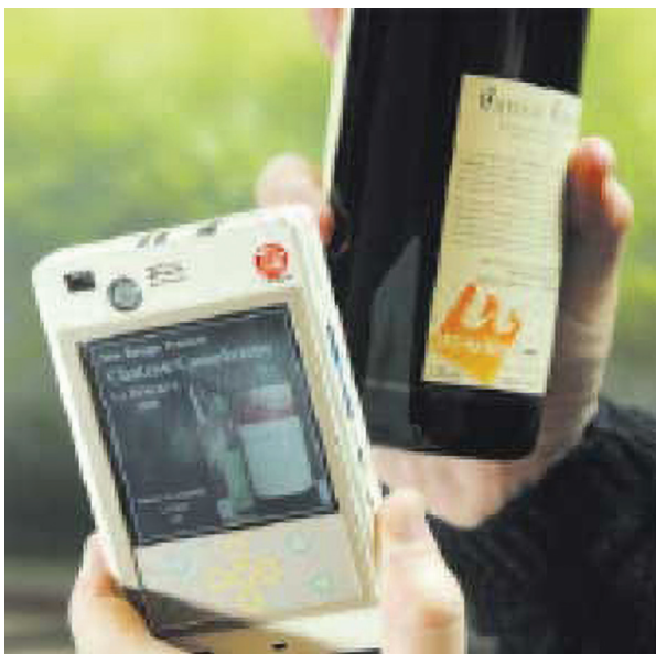
Slika 6 Sustav za očitavanje RFID tagova

Transponderi se dijele na: -aktivne i -pasivne. Aktivni transponderi rade na baterije, odašilju signal čitaču i mogu raditi na udaljenosti od oko 50 m. Pasivni transponderi rade na manjoj udaljenosti (do 5 m), ali rade na osnovu energije koju šalje čitač čime im omogućava neograničen vijek trajanja [12,13].