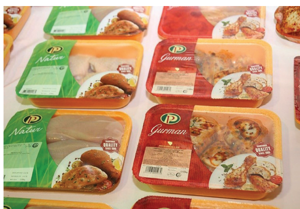
Slika 8 Pakiranje mesa u modificiranoj atmosferi