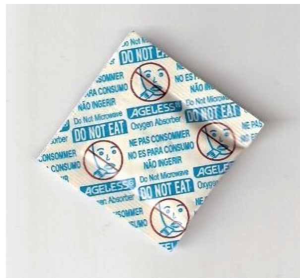
Slika 1 Željezni prah - "hvatač" kisika

Povećana koncentracija kisika unutar pakiranja dovodi do oksidacije pa time i kvarenja namirnice, stoga su razvijeni načini da se smanji koncentracija kisika. Jedan od temeljnih načina je da se koristi sakupljač (apsorber) kisika na bazi željeznog praha. Željezni prah se koristi na način da se stavi u propusne paketiće koji se implementiraju unutar ambalaže pa kako željezo hrđa tj. Oksidira, na taj način veže na sebe kisik i smanjuje njegovu koncentraciju unutar samog pakiranja. Postoje i razni moderni postupci koji se temelje na ugradnji aktivnih barijera u ambalažni materijal. Te ugrađene barijere bi prema potrebi propuštale više ili manje kisika ovisno o kakvoj se namirnici radi [2].