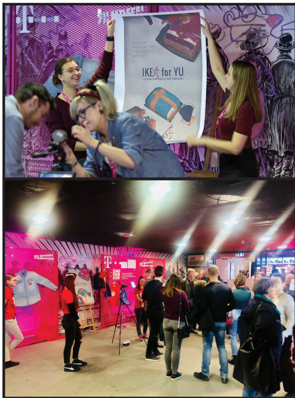
Slika 2 Postavljanje plakata i dvospektralne ZRGB kamere

Inividualizirane vrijednosti filmskog plakata moguće je promatrati pod postojećom rasvjetom u predvorju. Vidljivi spektar moguće je gledati neposredno okom, a blisko infracrveni kroz ZRGB kameru. Postavljena je ZRGB kamera sa LCD monitorom koje prikazuje dizajn plakata u oku nevidljivom području. U ovom radu informacije kreirane za infracrveni spektar izvedene su u jednostavnom obliku. Namjera je istražiti utjecaj dvospektnog sadržaja na interes publike.