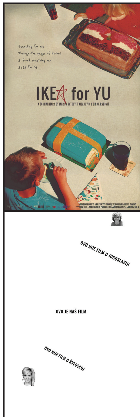
Slika 3 Filmski plakat u vidljivom i blisko infracrvenom spektru

Sadržaj u vidljivom dijelu spektra moguće je promatrati golim okom. Druga poruka ugrađena je u blisko infracrveno područje i promatrana je kroz konstruiranu ZRGB kameru (figure 3.).