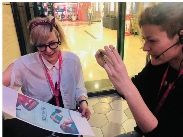
Slika 5 A4 izvedba plakata Figure 5 A4 version of the poster

S obzirom na veliki interes instalacije ZRGB kamere za potrebe prikaza plakata s dvostrukim vrijednostima u vidljivom i blisko infracrvenom području izvedena je manja, A4 verzija plakata koja se prezentirala tokom festivala posjetiteljima (figure 5.).