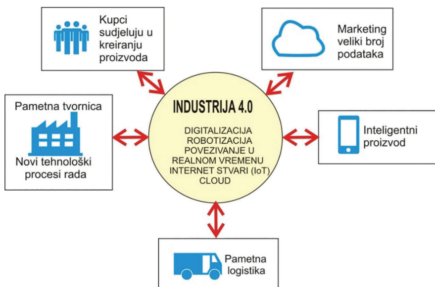
Slika 1 Koncept Industrije 4.0 – rezultat su jeftini personalizirani proizvodi dostavljeni na vrijeme kupcu [6] [10]

Koncept Industrije 4.0 podrazumijeva digitalizaciju i umrežavanje svih funkcija unutar tvornice i izvan nje, u kojoj na proizvodnim linijama rade roboti umjesto radnika.