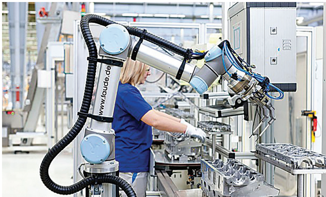
Slika 5 Suradnja kobotu UR10 i radnika u industriji motora [19]