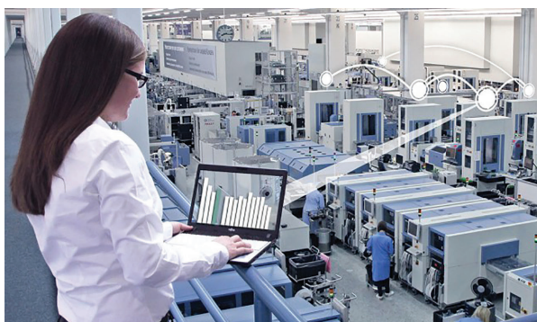
Slika 2 Siemensova tvornica elektronike u Ambergu, Njemačka [12]

Optimalno će reagirati na promjenjive zahtjeve tržišta, kooperacijske procese, zakonske i financijske promjene te na potrebu za specifičnim znanjima visokoobrazovnih stručnjaka. Sigurno je utjecaj obostran jer je tako nastala „pametna tvornica“ bitan čimbenik promjena u društvu i obrazovne politike. U žiži napretka su inovacije nastale, ne samo u vlastitoj sredini, već i na sveučilištu ili iz zajedničkih projekata. [1]